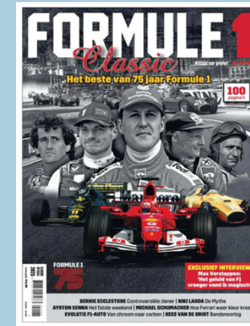
Special 2x per jaar